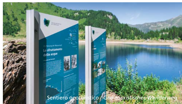
Sentiero geoturistico / Geo-touristischer Wanderweg