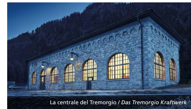
La centrale del Tremorgio / Das Tremorgio Kraftwerk

Il Lago Tremorgio è anche una preziosa testimonianza della storia della produzione idroelettrica del nostro Cantone. La centrale ai piedi della teleferica è infatti una delle più vecchie tuttora in funzione in Leventina. Le tavole de La via dell'energia di AET, poste alle stazioni di arrivo e di partenza della teleferica, raccontano questa storia.