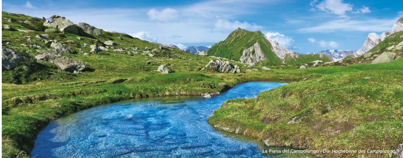
La Piana del Campolungo / Die Hochebene des Campolungo

+41 (0)91 867 15 44 info@campotencia.ch www.campotencia.ch