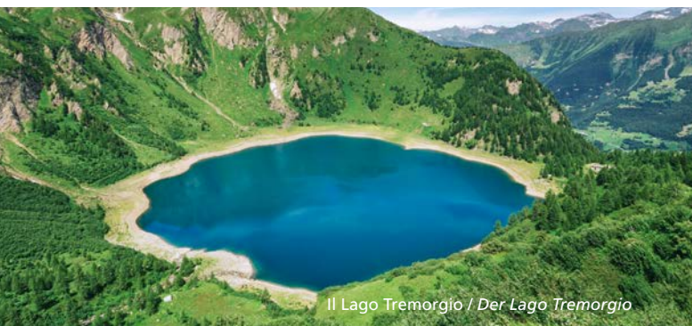
Il Lago Tremorgio / Der Lago Tremorgio

Supplemento trasporto di colli e/o materiali ingombranti (che occupano un posto): CHF 5. Gruppi/scuole: condizioni speciali su richiesta (contattare in orario d'ufficio). Zuschlag für voluminöses Gepäck/Rucksäcke: CHF 5. Gruppi/Schulklassen auf Anfrage (Informationen während den Bürozeiten).